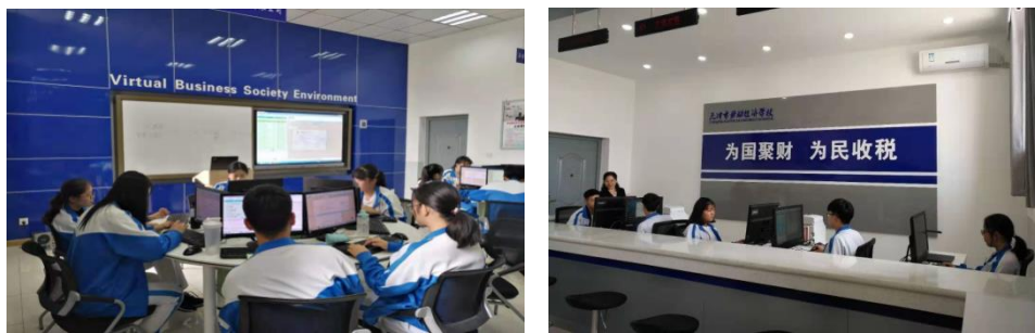
图 4 在 VBSE 实训室和模拟税务服务大厅开展实训教学

适应会计行业大数据、云财务的发展趋势，以“把企业搬进校园”为理念，于 2018 年建成 VBSE(虚拟商业社会环境)财务综合实训室和模拟税务服务大厅各一个，于 2021 年购入中联集团教育科技有限公司的“智能财税”实训软件一套，为开展学生毕业前会计分岗实训、社会化共享会计服务实训创造了条件。