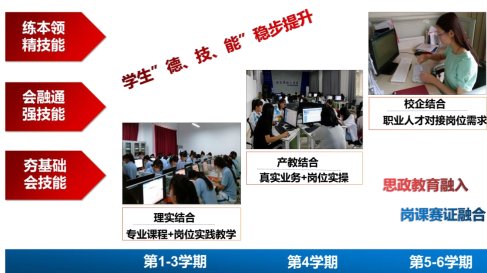
图1 “三段三结合”人才培养模式

依据《国家教育事业发展“十三五”规划》和我校的整体规划，以“坚持面向市场、服务发展、促进就业”为宗旨，在明确人才培养